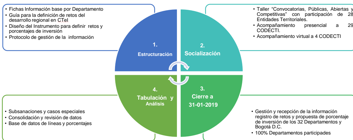
Figura 1. Proceso para la definición de retos del desarrollo regional